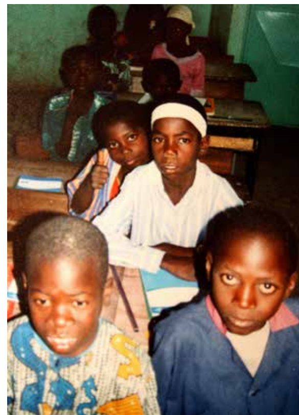
Classe primaire en brousse (Sénégal)*

« Le droit laïque étant passé par là, il n'est plus question de tolérance, mais tout simplement de liberté et d'égalité des citoyens dans l'exercice de leurs droits naturels ». (Henri Pena-Ruiz)