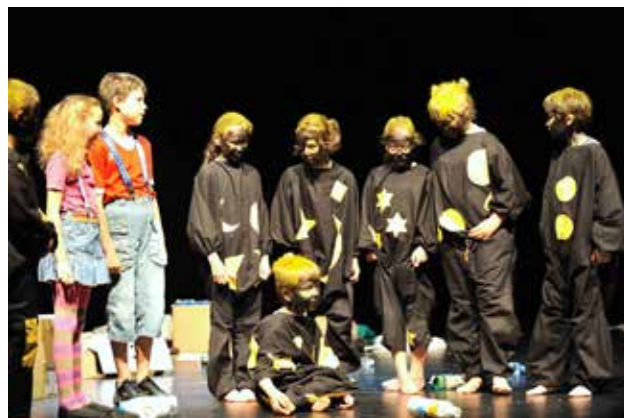
Des écoliers comédiens à Brest (France)*

Méfions-nous de la tolérance ( tolérer au sens propre c'est supporter ) ; mot inventé au XVIème siècle, les catholiques finissant par tolérer les protestants, mais ça ne va pas durer ! C'est la condescendance du plus fort qui permet à celui qui est dominé de vivre. « L'autorité qui tolère pourrait ne pas tolérer » disait Mirabeau. La tolérance n'a de sens que s'il s'agit de respect mutuel entre égaux au sein de la société.