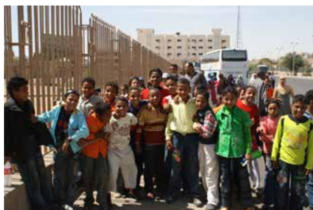
Classe de découverte archéologique à Assouan (Egypte)*