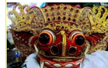
carnet de bord de recherche du metteur en scène Charlie Windelschmidt http://www.lamecaniquedumasque.com/

Bali, « l'île des dieux » (ainsi que la nomment trop souvent les brochures touristiques) est troublante pour les enjeux qu'elle représente : dotée d'un patrimoine naturel et culturel hors du commun, elle est néanmoins une plateforme du tourisme international et concentre des enjeux actuels majeurs de préservation du patrimoine mondial.