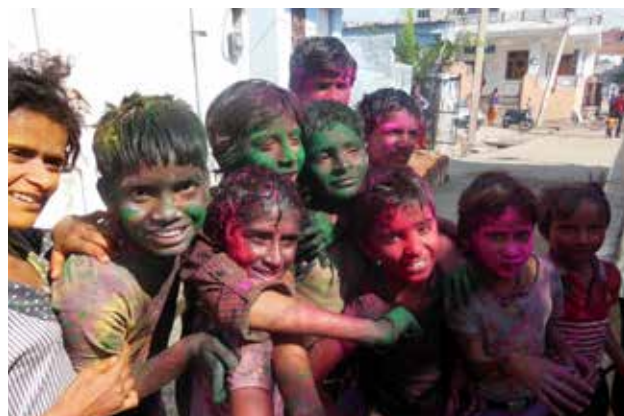
Fête traditionnelle des couleurs à Jaïpur (Inde)*