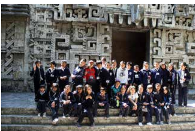
Collégiens en visite au musée national d'anthropologie (Mexique)*