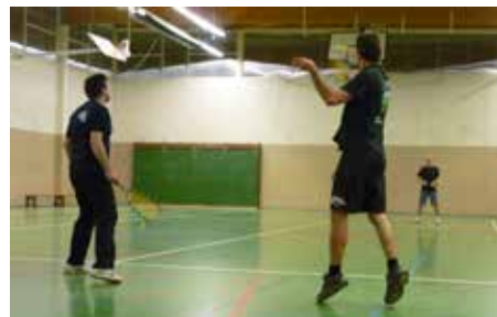
Speed-badminton Ufolep à Plouzané