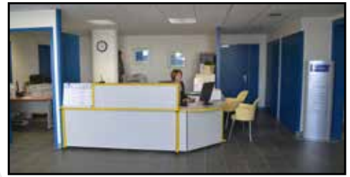
Le hall d'accueil