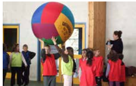
animation Kinball Usep