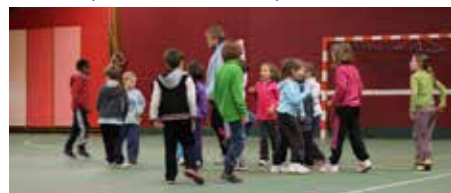
Hand-ball Ufolep à l'Hôpital-Camfrout