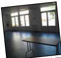
Les deux salles municipales attenantes accueillent diverses activités associatives.