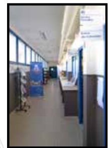
Un long couloir distribue les espaces.