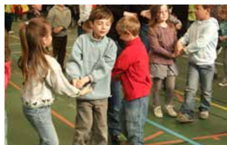
Bal breton à Landerneau