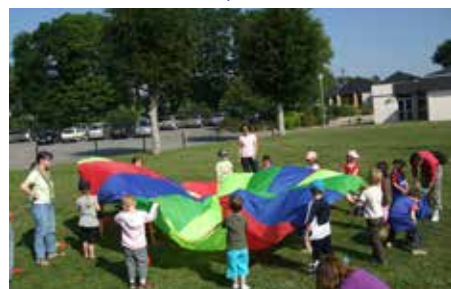
Rencontre «ça vole» à Saint-Evarzec