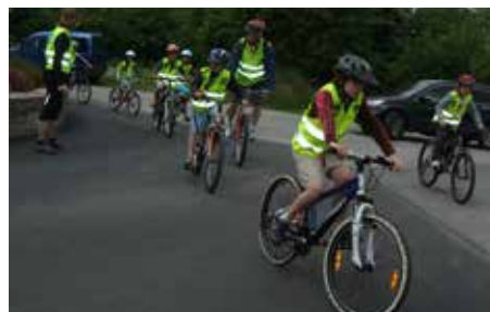
P'tit Tour Usep à Fouesnant